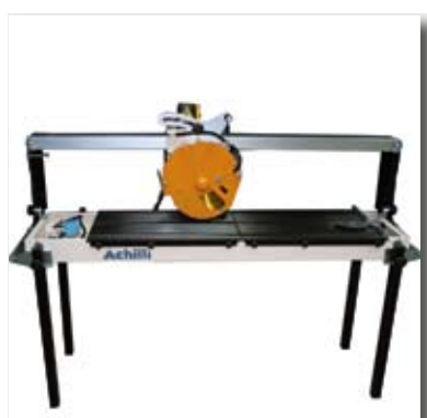
ATS 130 HT ► ATS 130 HT