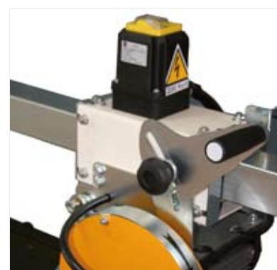
CUTTING DEPTH ADJUSTMENT ► Regolazione profondità di taglio