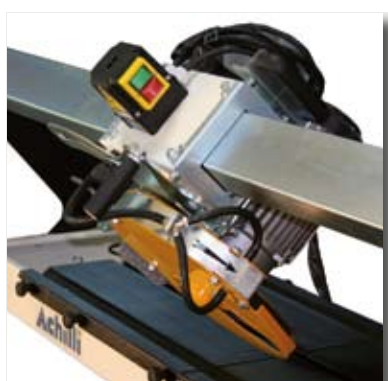
HEAD TILT AT 45° ► Inclinazione testa a 45°