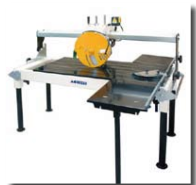
AFR-M ► AFR-M