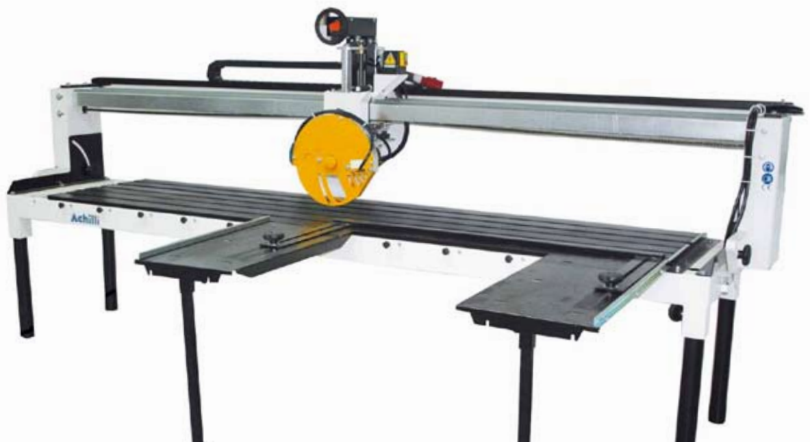
AFR-C ► AFR-C

MANUAL SAW WITH FIXED BRIDGE segatrice manuale a ponte fisso