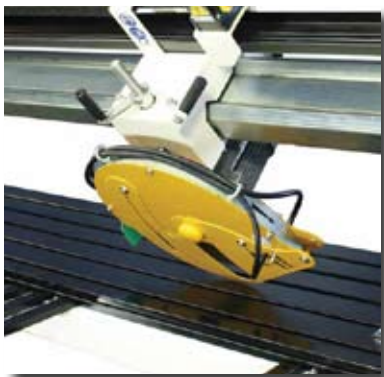
BRIDGE TILT AT 45 DEGREES ► Inclinazione ponte a 45°