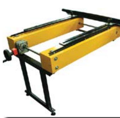
DEVICE FOR PARALLEL CUTS ► Dispositivo per tagli paralleli